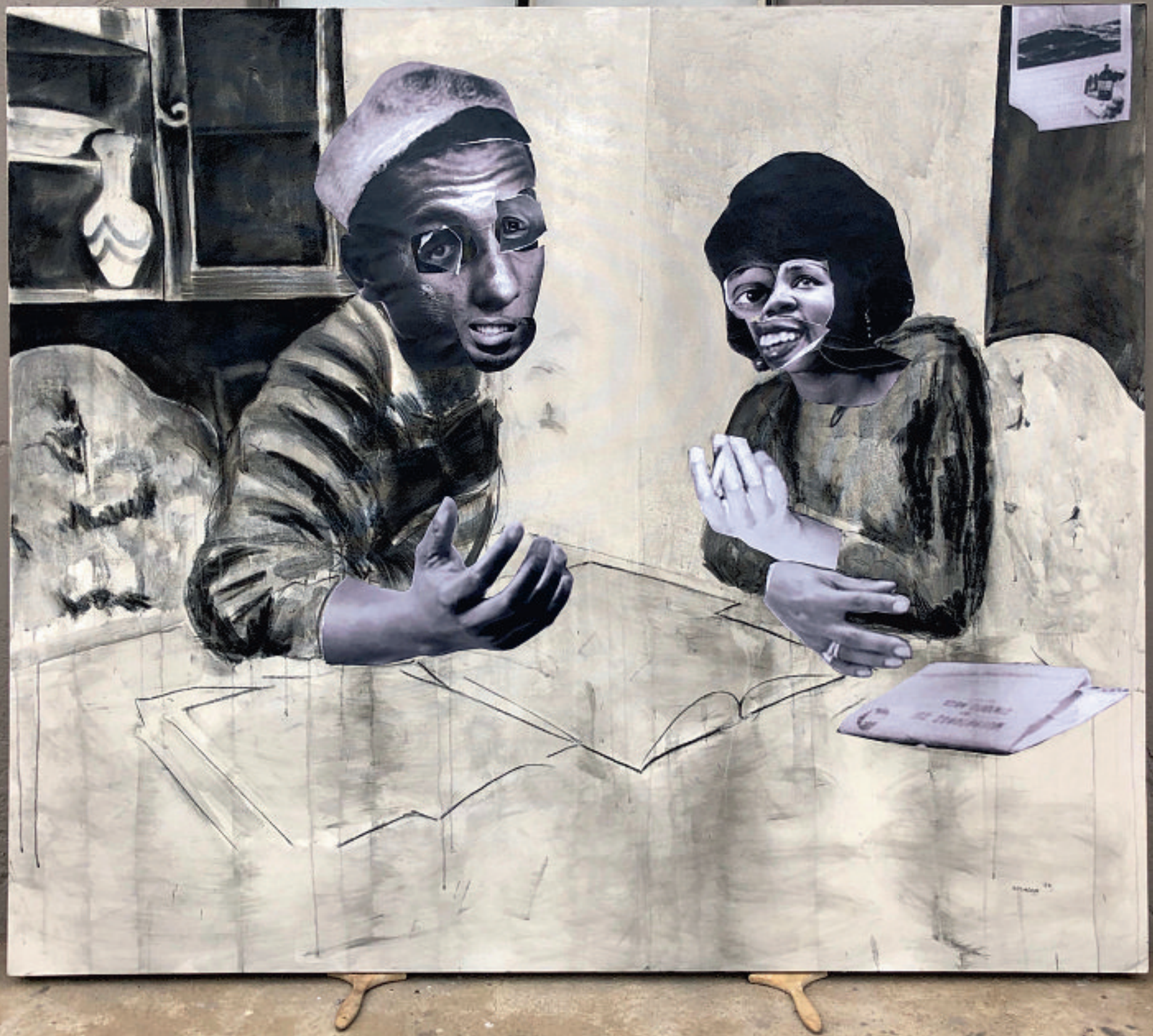
'Mamazala ka di potsotso' (2020). De collages zijn grote werken. Deze is twee meter breed.

Volgende pagina's: 'Motho waka' en 'Mpharanyana' (2020).